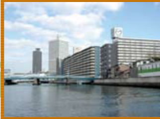
5 大阪天満宮御旅所