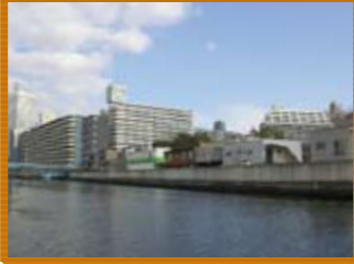
6 江之子島の府庁と市役所