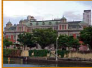
14 大阪市中央公会堂