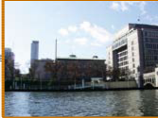
13 大阪府立中之島図書館