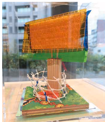
《良い素材集#4》2022年 発泡スチロール、ブルーシート、トラックシート、ビニールシート、キャンバス生地、割り箸、角材、合板、ネット、ビニールタイ、布、アクリルケース(高さ約30cm)

その中の一つ《ミラーボールの塔》は、主役とその裏側にあるものが組み合わさったらどう見えるか、という発想から生まれた作品。角材やワイヤーなどで組んだ架台に自転するミラーボールが天秤状に吊るされ、煌めくミラーボールとそれを支える無骨な架台の