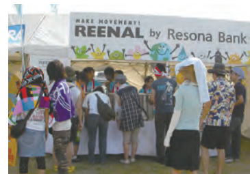
REISUITOUキャンペーン (2007年/万博記念公園お祭り広場)