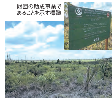
カリマンタン・ジュルンブン地区での森林消失状況。ここで植樹活動が行われている。