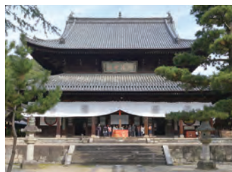
本堂の「大雄寶殿(だいおうほうでん)」。本尊の釈迦如来坐像の他、十八羅漢像を安置。

1661年に中国僧・隠元隆琦によって開創。隠元禪師は中国明朝時代の臨済宗を代表する僧で、中国福建省にある黄檗山萬福寺の住職。1654年に来日して当寺を開くにあたり、中国の自坊と同じ寺名を付けた。明治期に、宗派を黄檗宗に改名。煎茶や普茶料理をはじめ、いんげん豆や西瓜、蓮根、筍なども隠元禪師によって伝えられたといわれている。同寺では、中国風精進料理の「普茶料理」を食べることができる（要予約：☎0774-32-3900）。