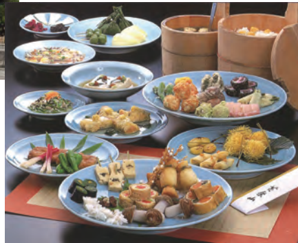
萬福寺の普茶料理(一例)

齋堂(さいどう:僧侶の食堂)前にかげられた開槌(かいばん:時を知らせる法具)。口から吐き出している玉は「煩惱」を表す。