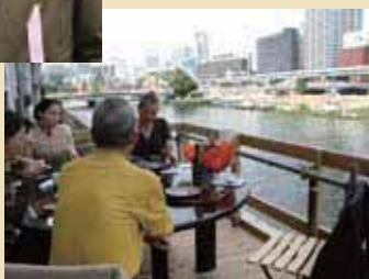
大阪川床「北浜テラス」／2008年10月1日～31日

仕組みなどを検討いただきました。平成20年度に1か月間限定で実験的に営業し、『水都大阪2009』で常設化。現在も3店舗が営業しています。次に『OSAKA旅めがね』。これは『水都大阪2009』のクルーズ&ウォーク企画として事業実施にいたった、地元案内人が大阪を案内するという新しい観光プログラムです。現在も好評進行中で、コースを作るエリアコーディネーター、案内するエリアクルー、地域の協力者などを合わせて約200人の協力を得ることができました。また観光船事業者にもクルーズ協力を頂いたり、いろんな方々に支えられています。ボランティアや助成金頼りでは継続困難な可能性もあるので、次の一手をどう打つかをつねに意識しながらやっています。その蓄積が、市民一人ひとりが水都の想いを蓄積していくことにもつながると思います。