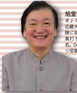
旭堂南陵氏(講談師) ぎよくどう なんりょう / 68年近畿大学入学と同時に先代旭堂南陵に師事。78年小南陵を襲名し真打ち昇進。06年4代目南陵襲名。04年大阪文化祭賞グランプリ受賞。