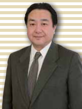
中村翫雀氏(歌舞伎役者) なかむら かんじゃく/’95年上方歌舞伎の大名跡、五代目中村翫雀を襲名。上方歌舞伎の継承に情熱を注ぐ。四代目坂田籐十郎の長男。屋号は成駒屋。