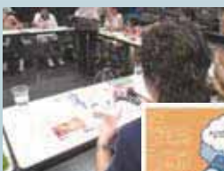
平成20年開催『1000DOORS』の講座風景