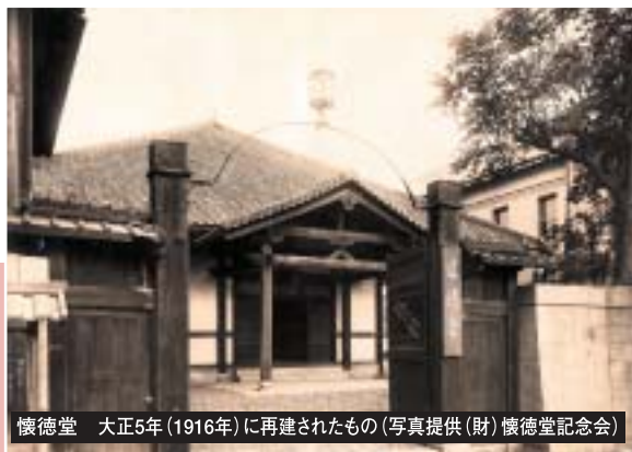
懐徳堂 大正5年(1916年)に再建されたもの