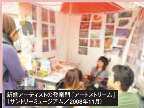
新進アーティストの登竜門『アートストリーム』 (サントリミュージアム/2008年11月)