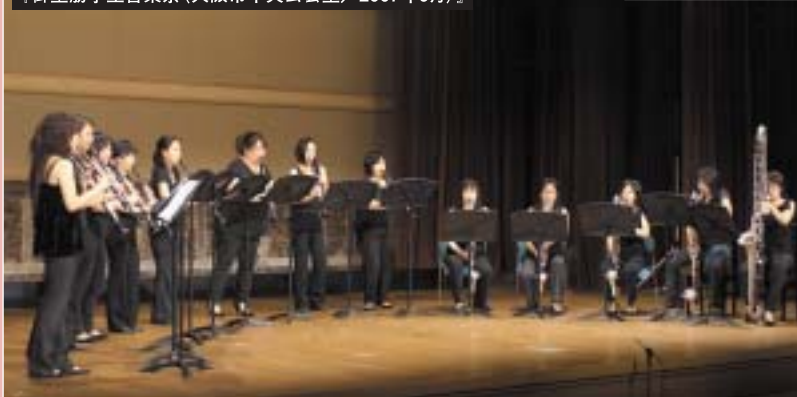
大阪の大学生がプロデュース 『御堂筋学生音楽祭 (大阪市中央公会堂/2007年9月)』