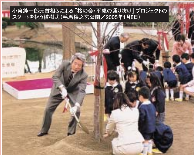
小泉純一郎元首相らによる「桜の会・平成の通り抜け」プロジェクトのスタートを祝う植樹式(毛馬桜之宮公園/2005年1月8日)