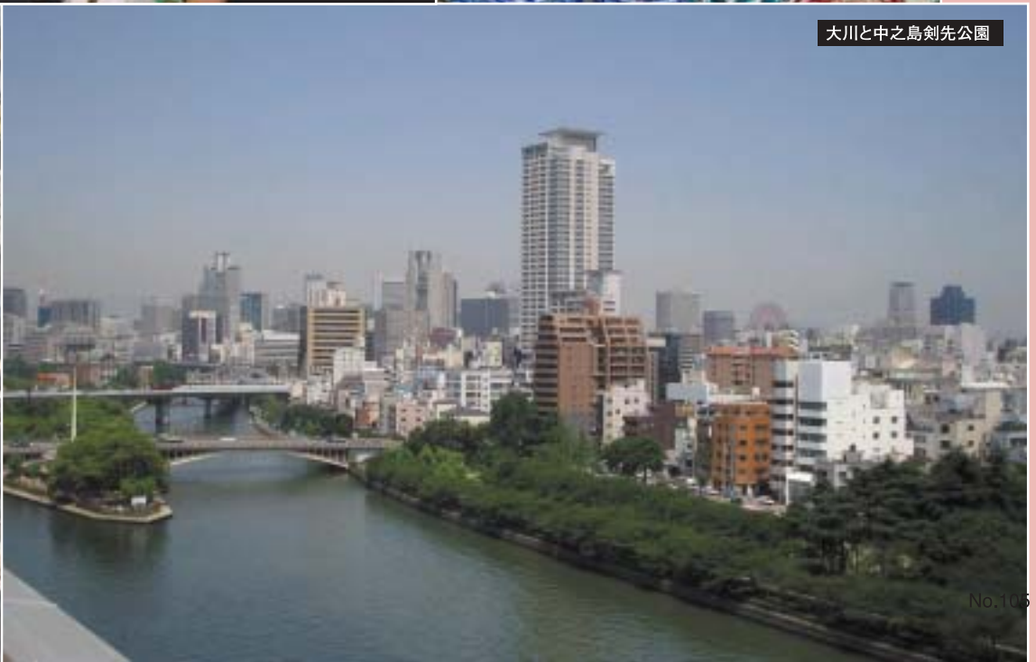
大川と中之島剣先公園