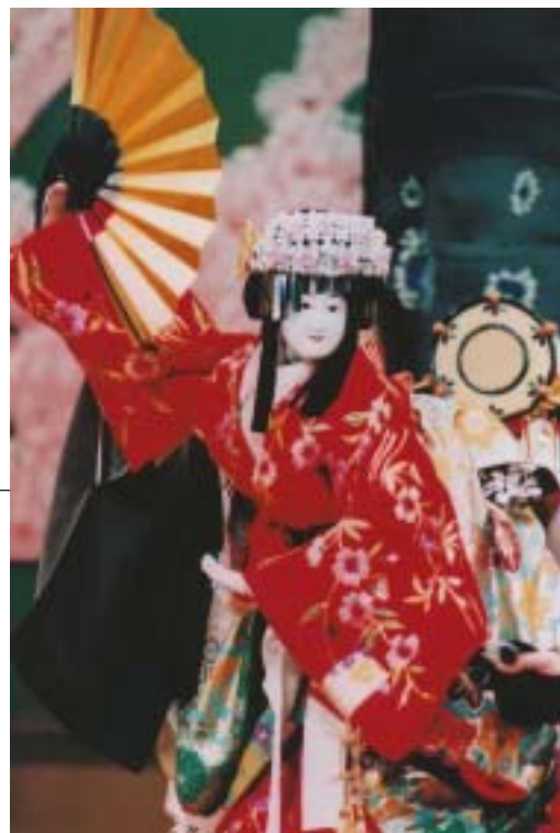
義経千本桜(よしつねせんぼんざくら)

当劇場は昭和59年にオープンして以来、今年で25周年。この間、文楽の鑑賞者層をさらに広げるため、通常の公演以外に子ども対象の『夏休み親子劇場』や高校生対象の『文楽鑑賞教室』、『社会人のための文楽入門』などを行ってきました。その成果があって、最近では若い皆さんの中にも文楽に対する興味が深まってきています。平成21年度は文楽公演で年間10万人以上の集客を目指して頑張っています。