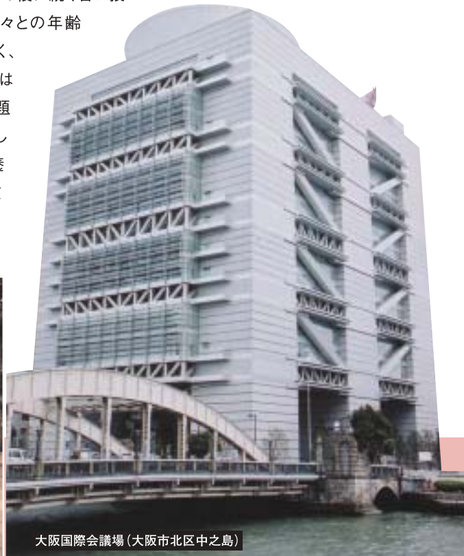
大阪国際会議場(大阪市北区中之島)