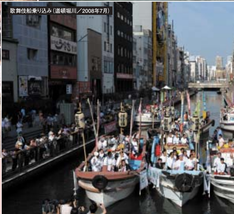
歌舞伎船乗り込み(道頓堀川/2008年7月)