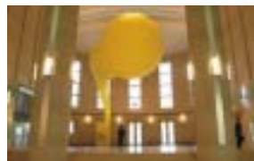
大阪・アートカレイドスコープ2008より

近代建築とアート作品のコラボレーション『水都アート回廊』、さまざまな分野の専門家による『水都記念シンポジウム』、大阪の素敵な場所を写真で募集する『大阪ステキ発見』など、まちとアートを楽しめます。