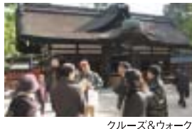
クルーズ&ウォーク

ウォーキングと川船で水都大阪の魅力を見つめ直す『クルーズ&ウォーク』、地元協力で船着場とその周辺に賑わい空間をつくる『船着場プログラム』を展開します。