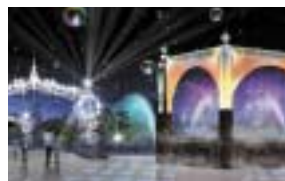
ナイトプログラム

ウォーターカーテン上で光・水・音・映像を駆使して水都大阪の魅力を伝える幻想的なショー『ナイトプログラム』や、季節の野菜や全国の特産品などが並ぶ『朝市&リバーマーケット』など、船着場で楽しむプログラムです。