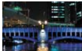
錦橋ライトアップ

土佐堀川左岸の川床を設置して川と美しい中之島を望む絶好のロケーションで料理を楽しむ『北浜テラス』、錦橋や難波橋などを光のアートで彩る『橋梁ライトアップ』など、水辺の景観を大人ムードで楽しめます。