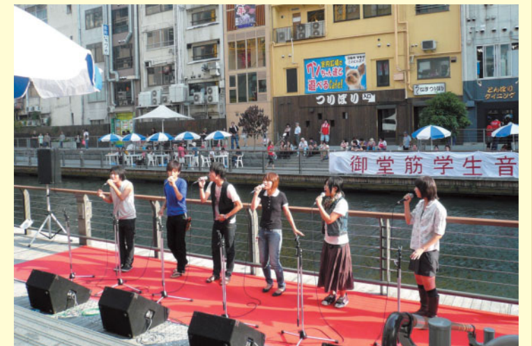
とんぼりリバーウォーク(道頓堀)

第3回御堂筋学生音楽祭実行委員会構成メンバー 大阪大学、大阪市立大学、大阪音楽大学、相愛大学、 関西学院大学、大阪モード学園、大阪21世紀協会(事務局)