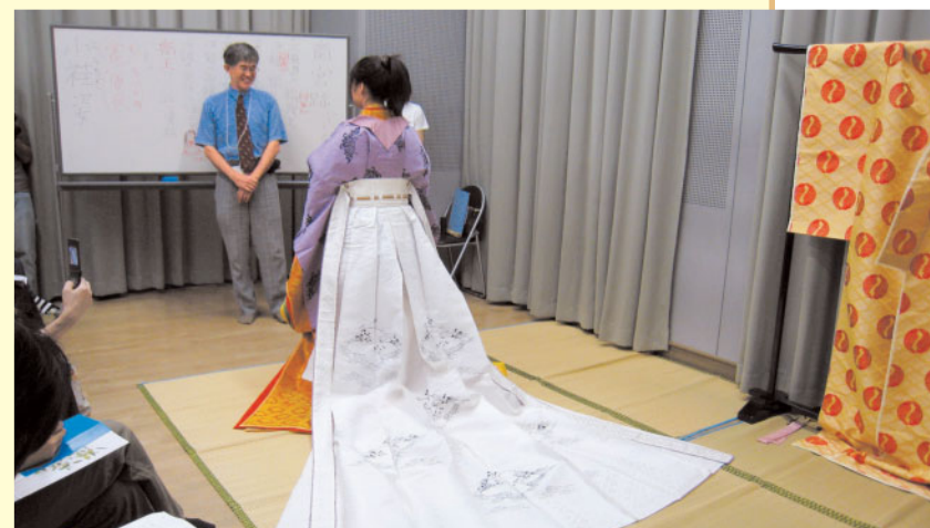
十二単の着付け公開と試着体験 / 榎村寛之ほか(斎宮歴史博物館ほか)

「文化は人が創る」をコンセプトに、体験を通して世代・ジャンル・国境を越えた人々が、自ら進んで明日の大阪の扉(DOOR)を開けようと呼びかけられた「100DOORS」。演劇、ダンス、古典芸能、楽器演奏、着付け、アート、メイク、英会話など、バラエティ豊かな体験講座が大阪市内3か所で行われ、子どもから大人まで多くの人々が参加しました。昨年度は38講座でしたが、好評につき今年は100講座。参加費をすべてワンコイン(500円)に設定したことも話題となり、テレビや新聞でも大きく報道されました。また本企画は、各界のエキスパートである講師陣と、それぞれの講座のとりまとめ役であるワークショップ・コーディネーター、そして事務局の二人三脚で運営されました。今後も関西独自の「おもろい」や「こだわり」をキーワードに、学術的に解釈されがちな芸術や文化を、より身近に楽しめる市民参加型フェスティバルへと育てていきます。