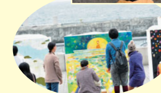
公募アーティストが2日間で仕上げる [2DAYペインティング]