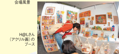
H@Lさん(アクリル画)のブース