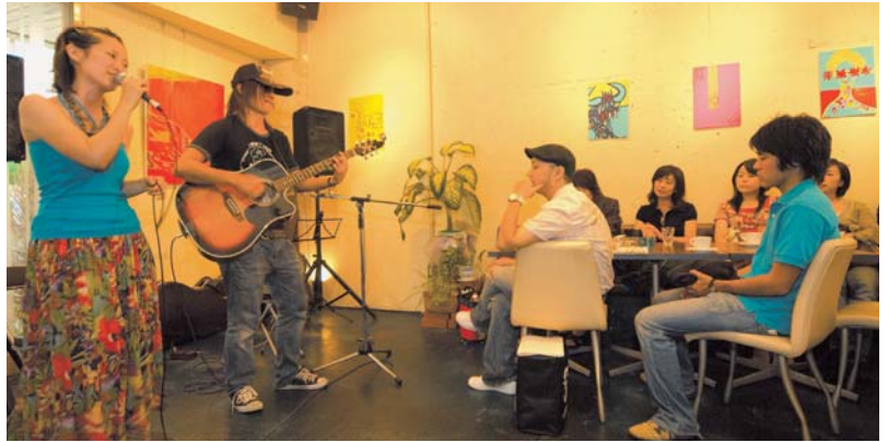
※写真は昨年度のものです。

大阪を中心とした関西圏の大学生を核に、多くの学生たちが自ら熱い情熱と豊かな想像力で企画し開催する御堂筋学生音楽祭。3回目となる今年は「つなげる。～City (Osaka) Student Music～」をテーマに、音楽を通してこのイベントに関わるあらゆる人・モノを繋げていこうというコンセプトのもと、「大阪の街の活性化」「大阪のイメージアップ」を試みるものです。「近頃の学生さんはアカンやん」ではなく、「近頃の学生さんもなかなかやりおんなー」と言っていたことを目標に、学生にしかできない音楽イベントをめざしています。