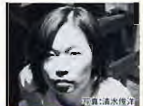
北村成美/日本 振付家/ダンサー