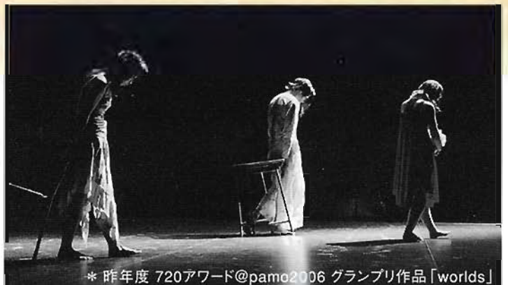
* 昨年度 720アワード@pamo2006 グランプリ作品「worlds」

2人の振付家によるコンテンポラリーダンス・ユニット。劇団hmpに所属していたメンバー3名によって結成、独自の活動を開始。ダンステクニックだけにとらわれず、音や照明、美術の作る空間にダンサーがどのように存在できるか、またそれらが生みだす時間やリズムに重きをおいた創作活動を行っている。2004年12月dance circus28で「...st.」を発表。以降、[踊りに行くぜvol.6vol.7関西選考会]や[神楽坂die pratz ダンスが見たい新人シリーズ4]にノミネート。2006年6月[dance box selection15]に選出。7月には[720アワード@pamo]でグランプリを受賞。現在大阪・京都を中心に活動中。