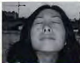
Nunu/中国 振付家/ダンサー