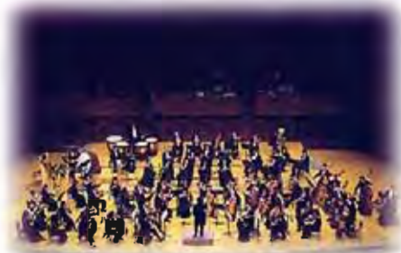
関西フィルハーモニー管弦楽団