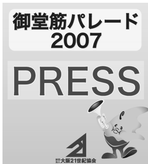
「プレスパス」(図はイメージ)