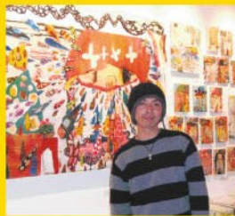
大阪21世紀協会賞、FM802賞 ●H@L

参加して、たくさんの方々に名前と作品を覚えて頂くと共に、今後の作品作りや売り込みに対しての課題を明確にする事が出来ました。この経験を活かして現在も様々なイベントに参加しています。近い将来、H@Lの作品を世界中で見たいと思える様、果敢に挑戦して行きたいと思えます。