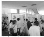
▲ブースA パーテーションブース