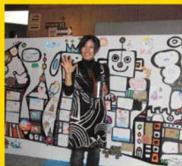
サントリーミュージアム賞 ●pokke104

アーティストとして生きることは非常に大変です。まだまだ日本でのアートマーケットが確立されていない今日において、このイベントによって救われるアーティストは本当に幸せ者だと思います。